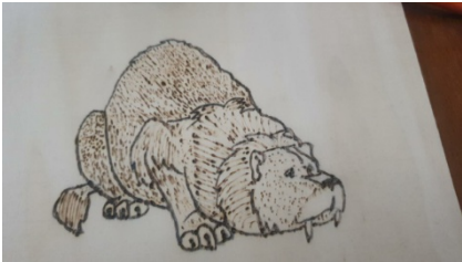
Con un successivo intervento con il pirografo, aggiunta peluria