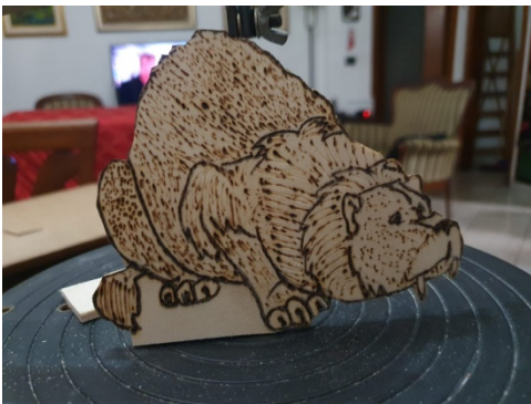
Risultato finale prima della collocazione su piedistallo