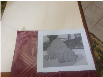
Trasferimento del disegno su legno

Per rappresentare il Sehlat con una dovizia di particolari, ho scelto di realizzare una rappresentazione su compensato.