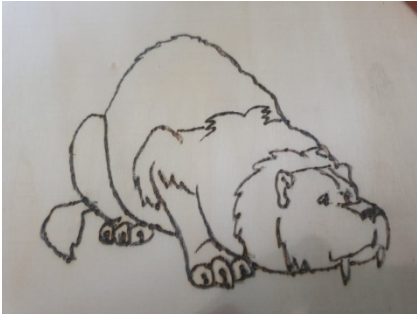
Risultato dopo la prima fase di pirografo